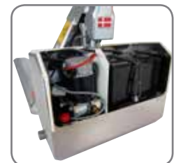
Wasserfeste Kapselung des Hubmotors (EHL RF-PLUS).

Bitte fordern Sie Werkstoff-Spezifikationen und kundenspezifische Lösungen an. Besuchen Sie auch www.logitrans.com .