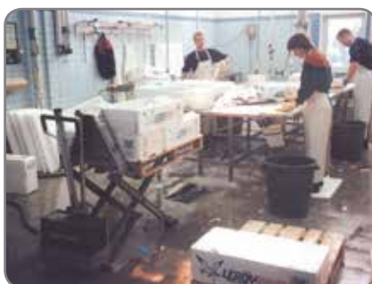
RF-SEMI - für die Lebensmittelindustrie in den Gebieten, wo Korrosionsbeständigkeit wichtig ist.