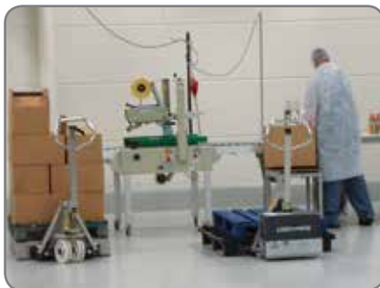
RF-PLUS - für die Lebensmittel- und Pharmaindustrie mit hohen Ansprüchen an Hygiene und Reinigung.

* Tragkraft reduziert sich von 1500 auf 1000 kg ab der Hubhöhe von 470 mm.