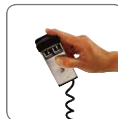
Fernbedienung, auch drahtlos, ist als Zubehör erhältlich (EHL).