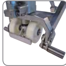
Optimale Sicherheit: Stützen bei den Lenkrädern, Fußschutz und zentrale Platzierung der Bedienungsfunktionen an der Deichsel.

EHL RF-SEMI: Deichsel, Achsen und Radhalter aus Edelstahl. Alle anderen Teile haben eine Polymer-Kunststoffbeschichtung oder sind chromit-behandelt. Batterie-Entladeanzeiger extra lackiert.