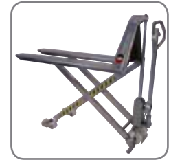
Der manuelle Scherenhubwagen ist auch in explosionsgeschützter Ausführung erhältlich.