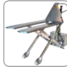
Geschlossene Gabel bedeutet einfache Reinigung und wenige Bakterienverstecke.