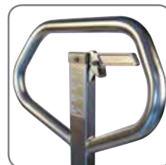
Ergonomische Deichsel sorgt für einen entspannten Griff.